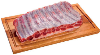
COSTELA SUÍNA KG