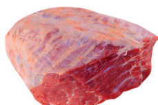
CUPIM BOVINO INTEIRO KG