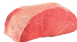
COXÃO MOLE BOVINO KG