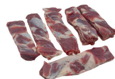
DEDINHO DO CONTRA FILÉ BOVINO KG