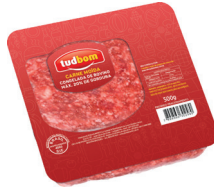
121 CARNE MOÍDA BOVINA TUDBOM CONGELADA 500G 7899566302580