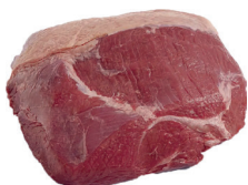
ALCATRA BOVINA COMPLETA