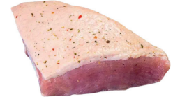
PICANHA SUÍNA KG