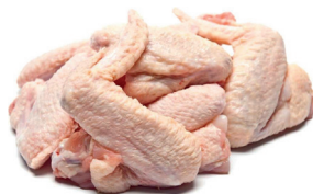
ASA DE PERU INTEIRA CONGELADA KG