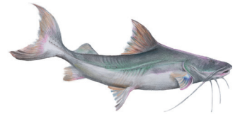
PEIXE PIRAMUTABA KG