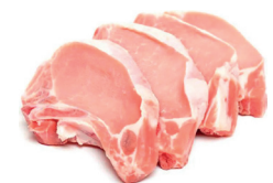
BISTECA SUÍNA FATIADA KG