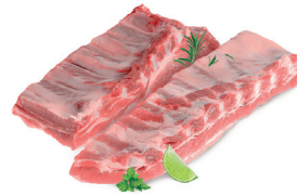
RECORTE DE COSTELA SUÍNA KG