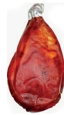
PALETA SUÍNA DEFUMADA KG