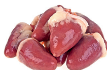
CORAÇÃO DE FRANGO CONGELADO KG