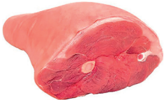
PERNIL SUÍNO KG