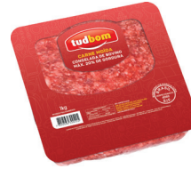
831 CARNE MOÍDA BOVINA TUDBOM CONGELADA 1KG 7899566300425