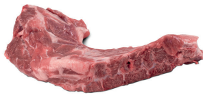
PONTA DE COSTELA SUÍNA KG