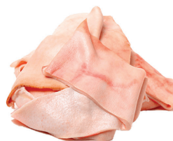
PELE SUÍNA KG