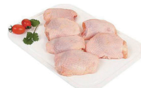
SAMBIQUIRA DE FRANGO CONGELADA KG