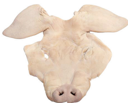
MÁSCARA SUÍNA COMPLETA COM FOCINHO E ORELHA KG