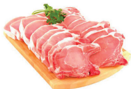
CARRÉ SUÍNO KG