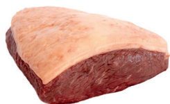
PICANHA BOVINA KG