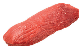
LAGARTO BOVINO INTEIRO KG