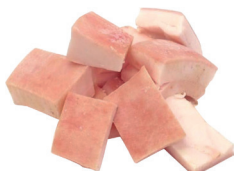
TOUCINHO SUÍNO PICADO EM CUBOS CONGELADO KG