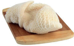
DOBRADINHA BOVINA RUMEN CONGELADA KG