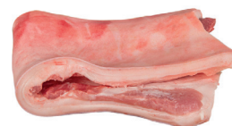
TOUCINHO SUÍNO LOMBAR KG