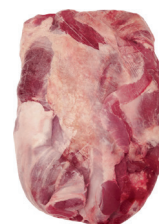
PALETA BOVINA COMPLETA COM MÚSCULO KG