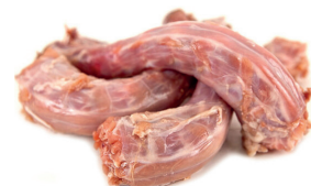
PESCOÇO DE PERU CONGELADO KG