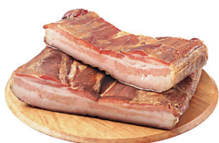
BACON SUÍNO EM MANTA KG