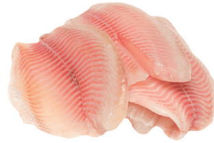
FILÉ DE TILÁPIA KG