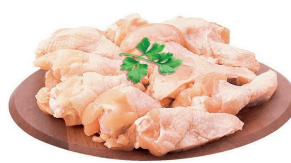
FRANGO A PASSARINHO CONGELADO KG