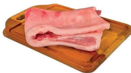
TOUCINHO SUÍNO COMUM KG