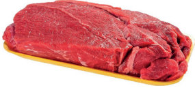
PALETA BOVINA COMPLETA SEM MÚSCULO KG