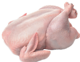
GALO INTEIRO CONGELADO KG