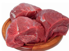
MÚSCULO BOVINO DIANTEIRO KG