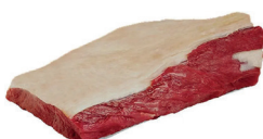
CAPA DE FILÉ BOVINO KG