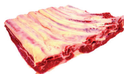
COSTELA BOVINA COM OSSO KG