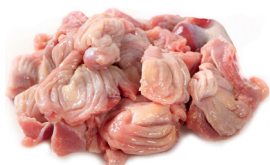
MOELA DE FRANGO CONGELADA KG