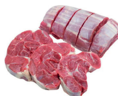
MÚSCULO BOVINO TRASEIRO KG