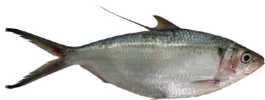
PEIXE SARDINHA LAGE KG