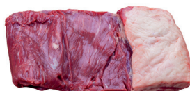
FRALDINHA BOVINA KG