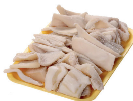
ORELHA SUÍNA KG