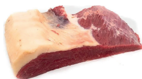
MAÇÃ DO PEITO BOVINO KG