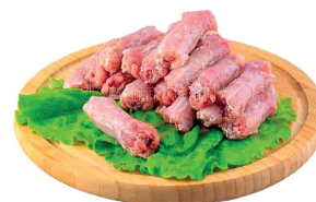
PESCOÇO DE FRANGO CONGELADO KG