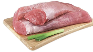
FILEZINHO MIGNON SUÍNO KG