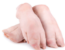
MÃOZINHA SUÍNA KG