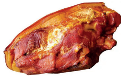
PERNIL SUÍNO DEFUMADO KG