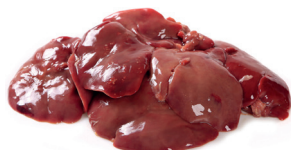
FÍGADO DE FRANGO CONGELADO KG