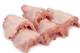
DORSO DE FRANGO CONGELADO KG