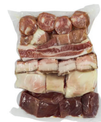
KIT FEIJOADA SUÍNA IN NATURA (PÉ, RABO E MÁSCARA) KG