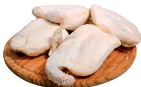
RABO SUÍNO KG