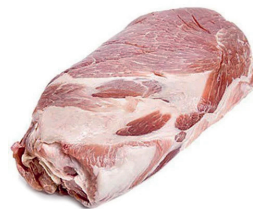
LOMBO SUÍNO CAPA SOBRE PALETA KG