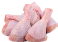
COXINHA DA ASA DE FRANGO DRUMETTE CONGELADA KG