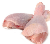
COXA DE FRANGO PILÃO CONGELADA KG