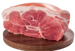
PALETA SUÍNA PAZINHA KG