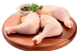
COXA E SOBRECOXA DE FRANGO CONGELADA KG