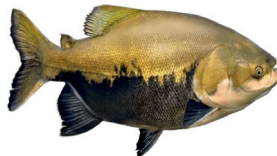
PEIXE TAMBAQUI KG