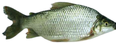
PEIXE CURIMBA KG