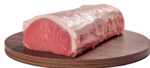
LOMBO SUÍNO KG