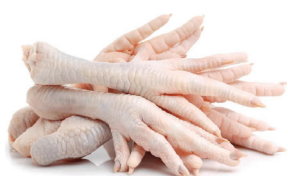
PÉ DE FRANGO CONGELADO KG