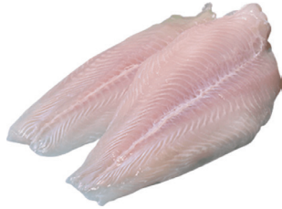
FILÉ DE MERLUZA KG