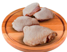
SOBRECOXA DE FRANGO CONGELADO KG