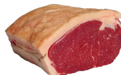
CONTRA FILÉ BOVINO KG