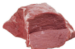
COXÃO DURO BOVINO KG