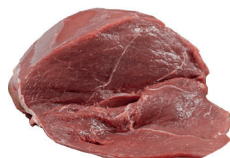
PATINHO BOVINO CONGELADO KG