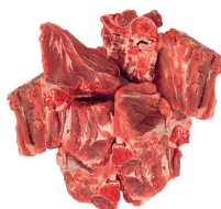
ESPINHAÇO SUÍNO KG